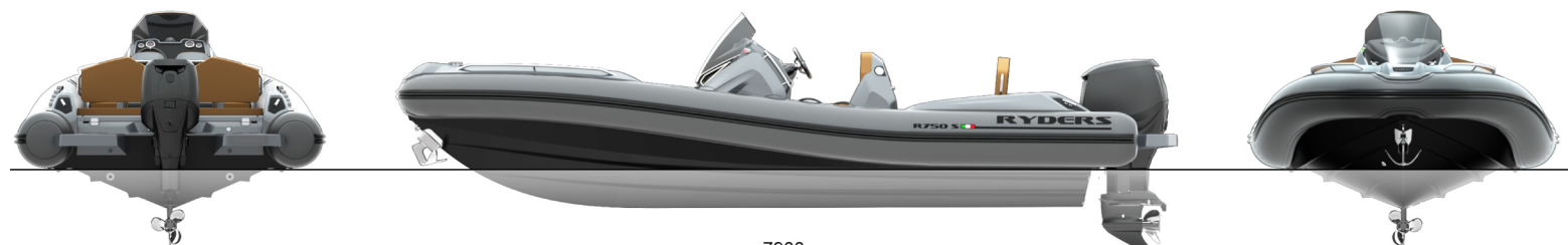
SINGLE OUTBOARD (XXL) min 225 hp / max 300 hp